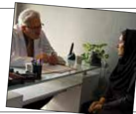
رخشان بنی‌اعتماد در سینما تکرار نمی‌شود