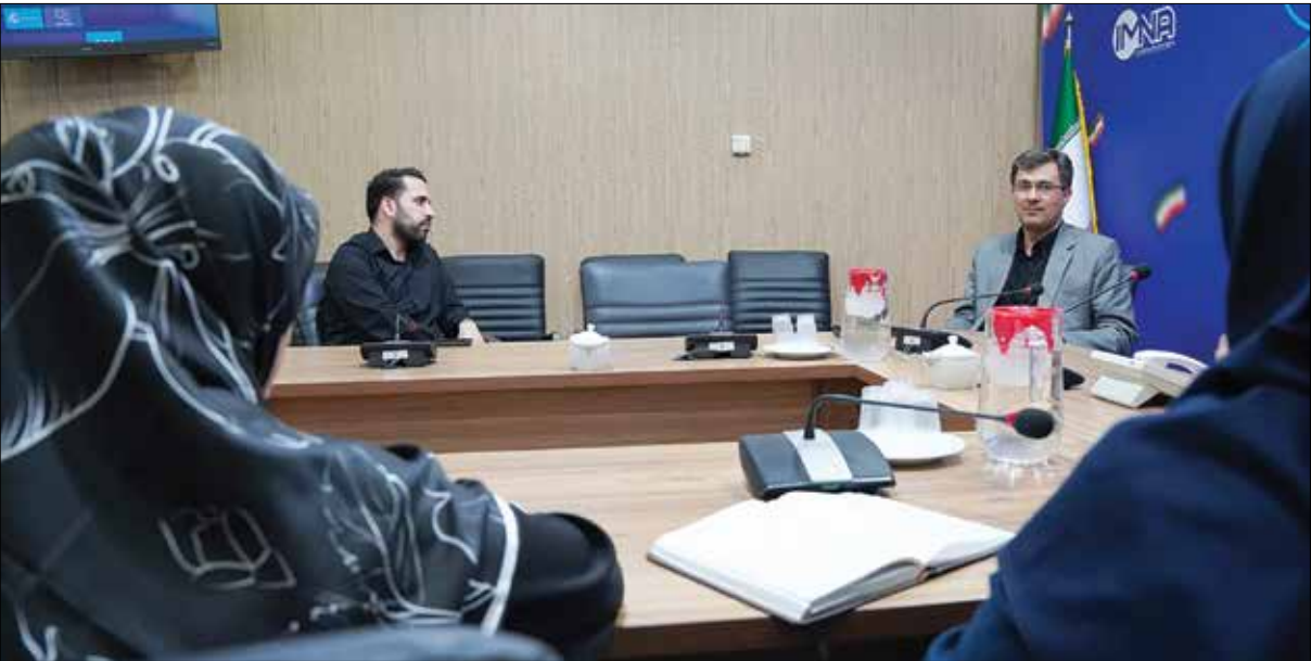
جلسه‌ای در خصوص راه‌های نوین برای بهبود خدمات شهری

که درخواست شهر هوشمند را دارد و جامعه‌ای که